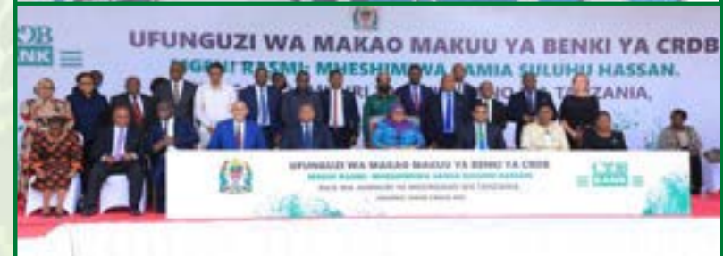
Rais wa Jamhuri ya Muungano wa Tanzania, Mhe. Samia Suluhu Hassan akiwa kwenye picha ya pamoja na Viongozi mbalimbali wakati wa uzinduzi wa jengo la Makao Makuu ya Benki ya CRDB, lililosanifiwa na Shirika la Nyumba la Taifa (NHC), Jijini Dar es Salaam.