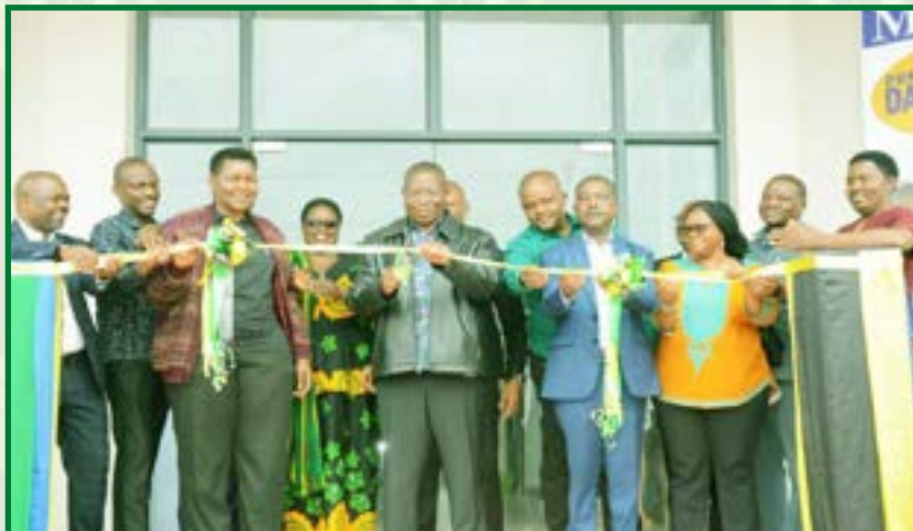
Makamu wa Rais wa Jamhuri ya Muungano wa Tanzania Mhe. Dkt. Philip Mpango (katikati) akizindua Jengo la Kitega Uchumi la Shirika la Nyumba la Taifa (NHC) lililopo mpaka wa Tanzania na Uganda eneo la Mutukula Wilaya ya Misenyi mkoani Kagera tarehe 18 Machi 2022. Kulia kwake ni Waziri wa Ardhi, Nyumba na Maendeleo ya Makazi Mhe. Dkt. Angeline Mabula pamoja na viongozi wengine.