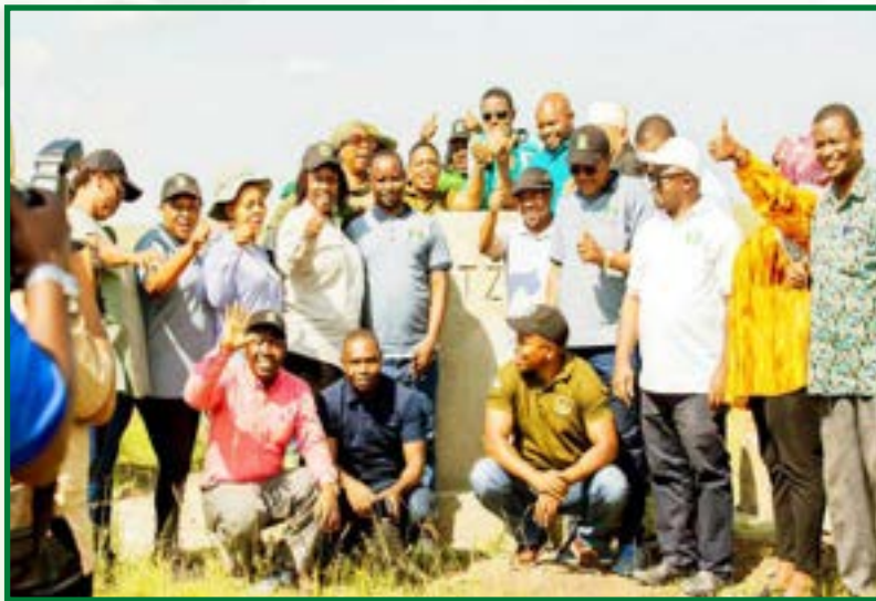
Naibu Waziri wa Ardhi Nyumba na Maendeleo ya Makazi Mhe. Ridhiwani Kikwete akiwa na baadhi ya wajumbe wa Kamati ya Kudumu ya Bunge ya Ardhi Maliasili na Utalii katika mpaka wa Tanzania na Kenya ndani ya mbuga ya Serengeti mkoani Mara.