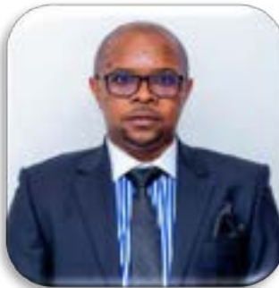
MHE. RIDHIWANI JAKAYA KIKWETE (MB.) NAIBU WAZIRI