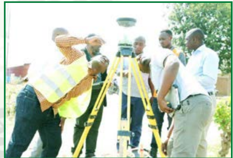
Wataalamu kutoka chuo cha Ardhi Morogoro (ARIMO) wakiwa katika matayarisho ya awali ya kazi ya urasimishaji makazi holela katika mji mdogo wa Mbalizi mkoani Mbeya.