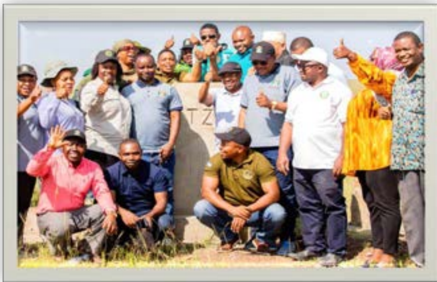
Naibu Waziri wa Ardhi Nyumba na Maendeleo ya Makazi Mhe. Ridhiwani Kikwete akiwa na baadhi ya wajumbe wa Kamati ya Kudumu ya Bunge ya Ardhi Maliasili na Utalii katika mpaka wa Tanzania na Kenya ndani ya mbuga ya Serengeti mkoani Mara.

88. Mheshimiwa Spika , katika mwaka 2021/22, Wizara iliahidi kuendelea na uimarishaji wa mipaka ya nchi kavu yenye urefu wa kilometa 100 kati ya Tanzania na Burundi na kilometa 128 kati ya Tanzania na Kenya kwa kushirikiana na mamlaka za Serikali za nchi hizo. Napenda kuliarifu Bunge lako Tukufu kuwa hadi tarehe 15 Mei, 2022, kilometa 83 za mpaka wa Tanzania na Kenya zimeimarishwa na kazi inaendelea. Pia, ramani za msingi za mpaka kwa kipande cha kilometa 238 kutoka Ziwa Viktoria hadi Ziwa Natron ambazo zitatumika kuandaa Mkataba wa mpaka zimeandaliwa.