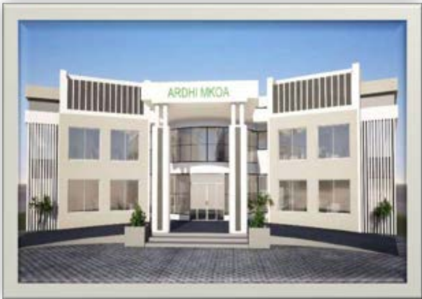
Mchoro wa Jengo la Ofisi za Ardhi zinazotarajiwa kujengwa katika mikoa 25 nchini

87. Mheshimiwa Spika , katika mwaka 2022/23, Wizara imepanga kujenga majengo ya Ofisi za Ardhi za Mikoa 25 ; kuboresha mfumo wa ILMIS; kutoa Hatimiliki 150,000 katika Halmashauri 10 ; kutoa Hati za Hakimiliki za Kimila 50,000 katika Vijiji 50 ; kuandaa Mipango ya Matumizi ya Ardhi ya Vijiji 50 katika Wilaya sita ( 6 ) na Mipango ya Matumizi ya Ardhi ya Wilaya hizo; na kutoa Leseni za Makazi 250,000 . Katika utekelezaji wa kazi hizi, Wizara inatarajia kutoa fursa za ajira za muda mfupi 2,300 na vibarua 4,200 .