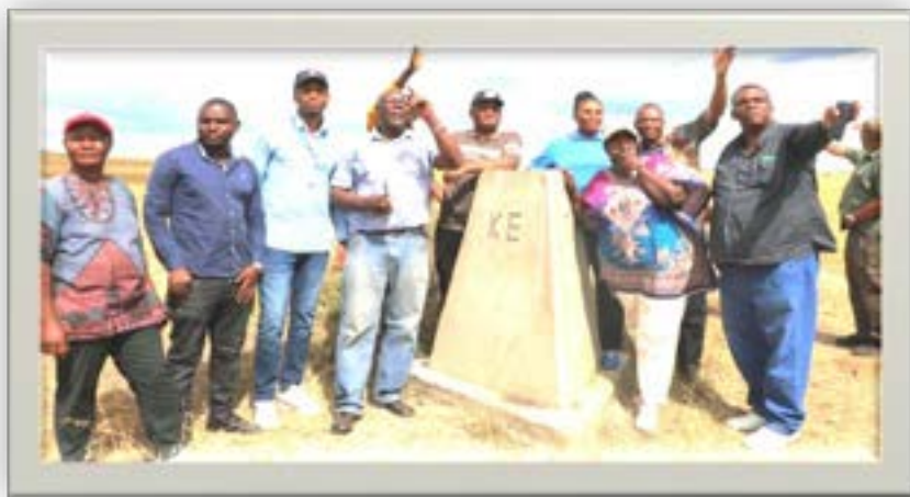
Timu ya Wataalam wa upimaji kutoka nchi za Tanzania na Kenya ikiangalia muelekeo wa mpaka wa nchi hizo katika eneo la Serengeti/ Masai Mara.