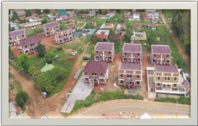
Ujenzi wa nyumba za gharama nafuu katika Halmashauri za Sumbawanga