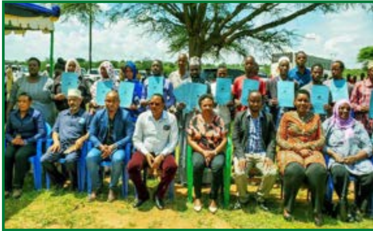
Waziri wa Ardhi Nyumba na Maendeleo ya Makazi Mhe. Dkt Angeline Mabula akiwa katika picha ya pamoja na wananchi waliokabidhiwa hatimiliki za kimila wakati kamati ya Bunge ya Ardhi, Maliasili na Utalii ilipokwenda kukagua utekelezaji wa Mradi wa Upangaji Matumizi ya Ardhi katika vijiji vya Ntondo na Nkwea mkoani Singida tarehe 15 Machi 2022.