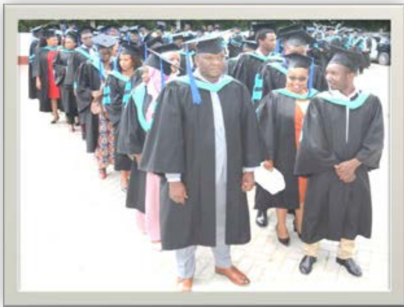
Baadhi ya Wahitimu wa Mafunzo ya Usajili wa Kudumu wa Uthamini kwa mwaka 2022.