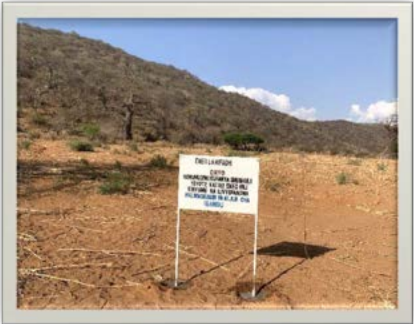
Bango linaloonyesha moja ya eneo lillotengwa kwa ajili ya Uhifadhi lililosimikwa mara baada ya kuandaa mpango wa matumizi ya ardhi ya kijiji cha Igandu Wilayani Chamwino likionyesha kupiga marufuku shughuli yoyote katika eneo hilo

na wadau mbalimbali nchini. Mipango hii inawezesha kutenga maeneo kwa ajili ya matumizi mbalimbali ya ardhi ikiwemo makazi, kilimo, nyanda za malisho, uwekezaji, uhifadhi, ardhi ya akiba na mapito ya wanyamapori. Mipango hiyo inawezesha kudhibiti migogoro ya ardhi, kulinda ikolojia na mazingira, kutoa milki salama kwa wananchi na hivyo kuongeza tija katika matumizi ya ardhi, uzalishaji mali na kuinua uchumi wa jamii na Taifa.