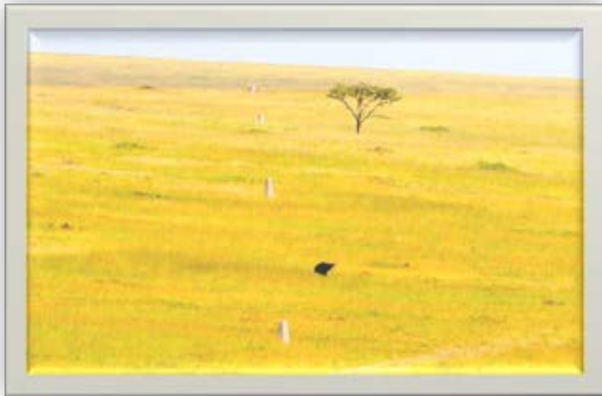
Alama za mpaka wa Kimataifa kati ya Kenya na Tanzania uliopo Serengeti Mkoani Mara