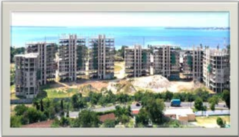
Maendeleo ya mradi wa Ujenzi wa (Satellite Town) Kawe jijini Dar es salaam