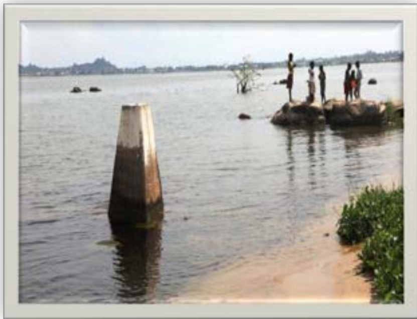
Muonekano wa alama ya mpaka ardhini (BP MWISHONI) eneo la Kirongwe lililopo wilaya ya Rorya mkoani Mara na Muhuru Bay iliyopo Kaunti ya Migori upande wa Kenya.

hurahisisha kazi, kupunguza muda na gharama za upimaji ardhi. Katika mwaka 2021/22, Wizara iliahidi kusimika alama mpya za msingi 80 katika maeneo mbalimbali nchini. Hadi kufikia tarehe 15 Mei, 2022 alama za msingi za upimaji 68 zilisimikwa katika Mikoa ya Dar es Salaam (5), Arusha (8), Dodoma (11), Mara (7), Njombe (8), Simiyu (3), Kigoma (8), Manyara (5), Tanga (5), na Geita (8) na hivyo kuwa na alama za upimaji 935 nchini. Katika mwaka 2022/23 Wizara itasimika alama mpya za msingi 80 .