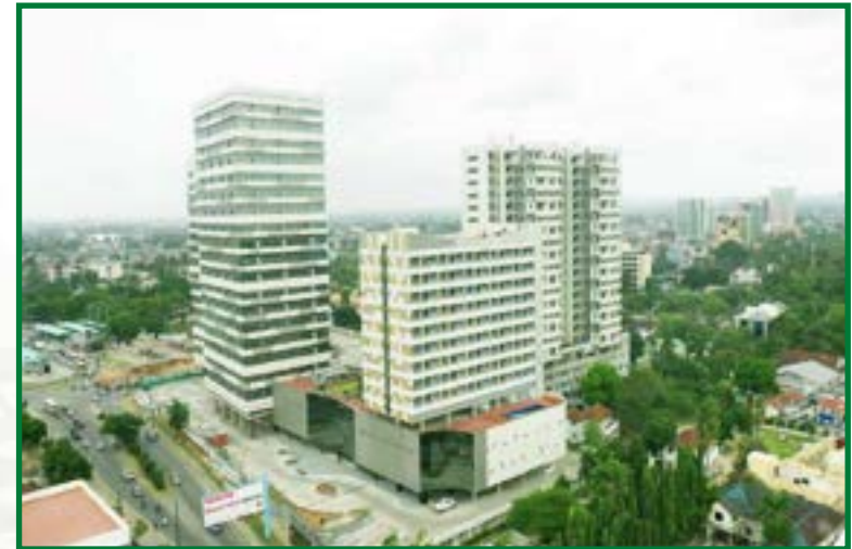
Maendeleo ya Ujenzi wa Mradi wa Morocco Square unaotekelezwa na Shirika la Nyumba la Taifa (NHC)