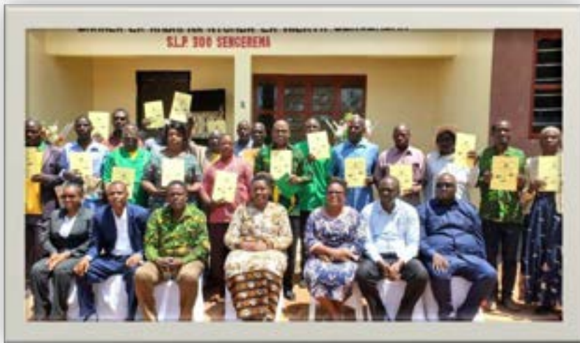
Waziri wa Ardhi Nyumba na Maendeleo ya Makazi Dkt Angeline Mabula akiwa na wakazi wa wilayani ya Sengerema mkoani Mwanza baada ya kuzindua Baraza la Ardhi na Nyumba la Wilaya na kugawa miongozo ya uendeshaji wa Mabaraza tarehe 21 Machi 2022.

39. Mheshimiwa Spika , ili kusogeza huduma karibu na wananchi, Wizara katika mwaka 2021/22 iliahidi kuongeza idadi ya Mabaraza yanayotoa huduma ambapo hadi kufikia tarehe 15 Mei, 2022, Mabaraza mapya 20 yameanza kutoa huduma na hivyo kuwa na jumla ya Mabaraza 80 yanayotoa huduma kati ya Mabaraza 139 yaliyoanzishwa. Katika mwaka 2022/23, Wizara inatarajia kushughulikia mashauri 33,250 na itawezesha Mabaraza mapya 59 kuanza kutoa huduma na hivyo kuwa na Mabaraza yanayotoa huduma katika Wilaya zote nchini.