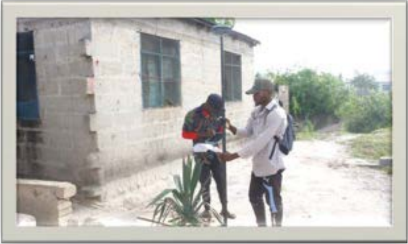
Kazi ya urasimishaji makazi ya wakazi wa Kivule Jijini Dar es salaam likiendelea