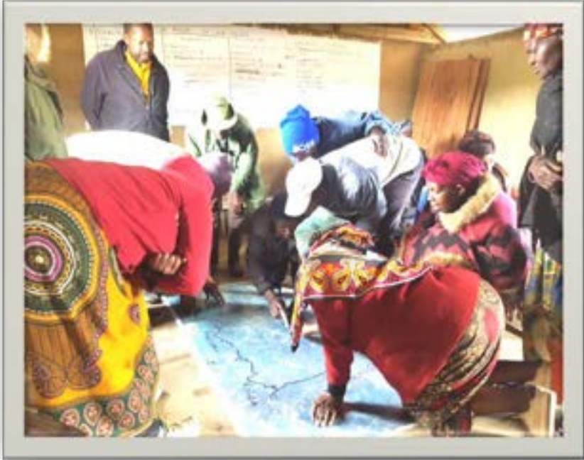
Baadhi ya wananchi wa kijiji cha Lumage wilayani Makete wakishiriki zoezi la uandaaji wa mpango wa matumizi ya ardhi kwa kutumia picha ya anga (satellite image)