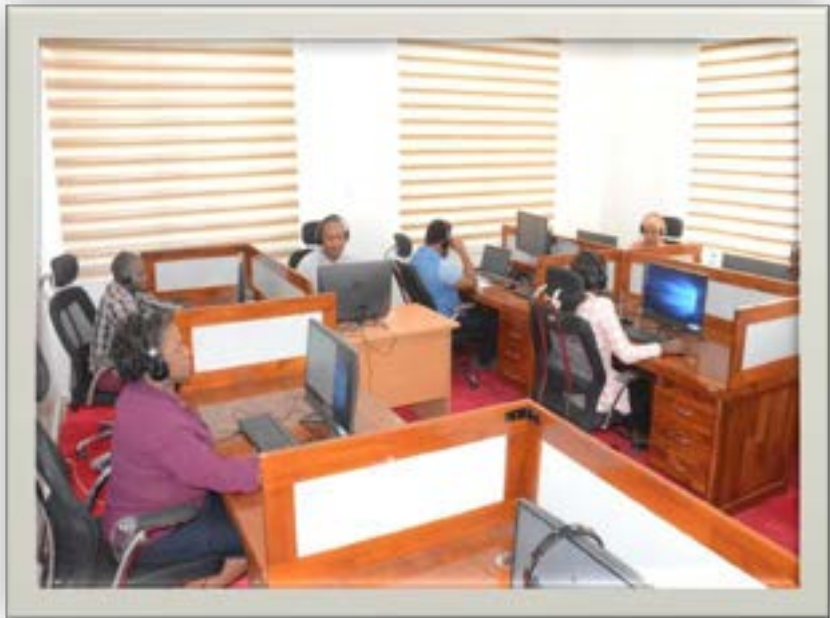
Kituo cha mawasiliano kwa wateja kilichopo Mtumba Jijini Dodoma

27. Mheshimiwa Spika , katika mwaka 2021/22, Wizara ilipanga kutatua migogoro ya ardhi 1,000 kiutawala. Hadi kufikia tarehe 15 Mei, 2022 migogoro 1,898 kati ya migogoro 1,635 iliyopokelewa na kutatuliwa ( Jedwali Na.4 ). Aidha, Wizara iliendelea na utaratibu wa kutatua migogoro ya ardhi inayowasilishwa na wananchi.