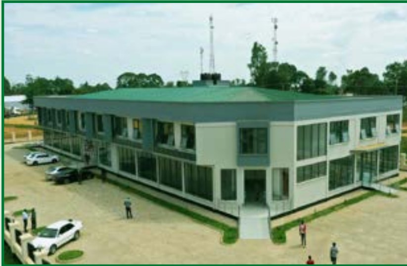
Muonekano wa Jengo la Kitega Uchumi la Shirika la Nyumba la Taifa (NHC) lililopo mpaka wa Tanzania na Uganda eneo la Mutukula Wilaya ya Misenyi mkoani Kagera.