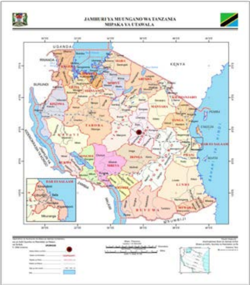
Ramani ya Rasmi ya Jamhuri ya Muungano wa Tanzania inayoonesha mipaka ya kiutawala